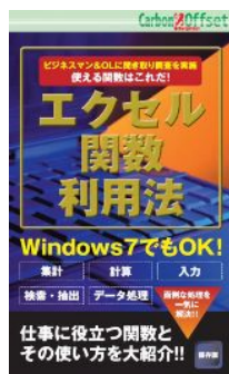
「エクセル関数利用法」