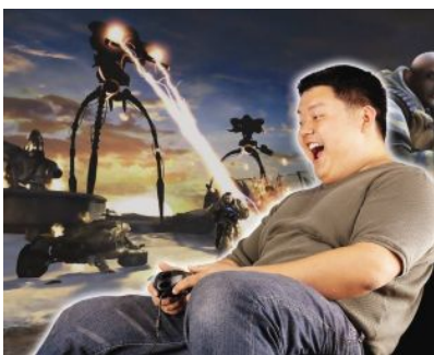
エキサイトするTVゲーム

オーディオ機器に接続することによって、お気に入りの音楽に包み込まれながら癒され安心感を得られます。外出時に活躍するポータブルオーディオ機器も、接続するだけで迫力あるオーディオ機器に早変わりします。