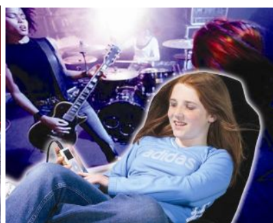
大好きな音楽でリラックス

上記に関する取材・お貸出などのお問い合わせは 株式会社 アントレックス 広報担当: 馬橋(まばし) 東京都新宿区新宿5-8-5 TEL:03-5368-1819 FAX:03-5368-1802 MAIL: prs@entrex.co.jp