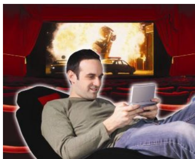
狭くたってどこでもホームシアターへ